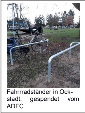
Fahrradständer in Ockstadt, gespendet vom ADFC